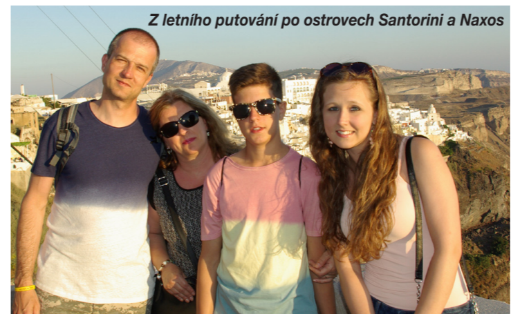
Z letního putování po ostrovech Santorini a Naxos